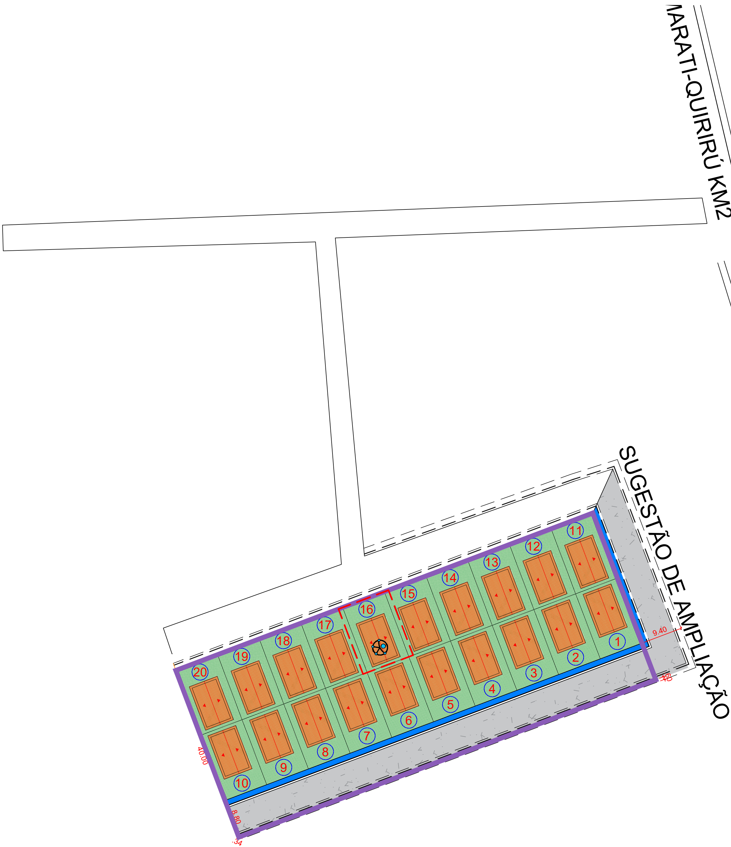
1 IMPLANTAÇÃO ESC:1/500